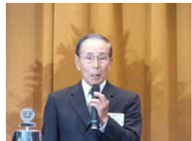
河野知宏 次期ガバナー補佐