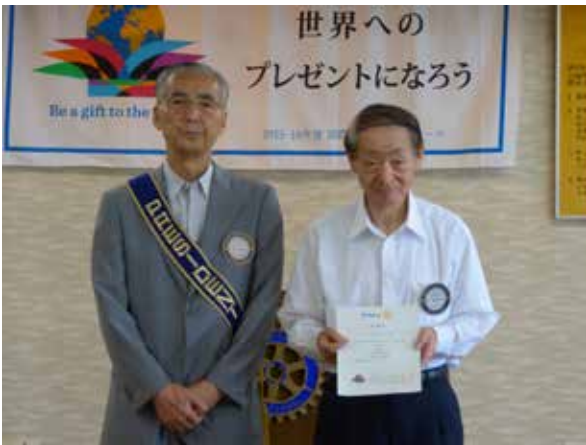
平間陸生会員 理事、副会長、クラブ研修委員、米山奨学会委員