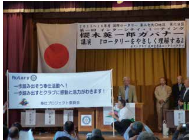
奉仕プロジェクト委員会