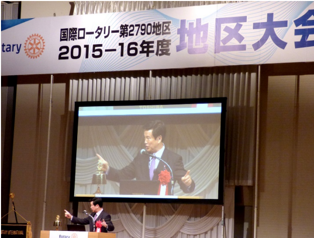
森田健作千葉県知事の祝辞