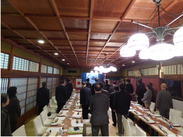
ロータリーソング斉唱