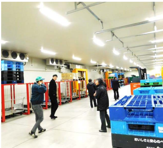
しっかり着込んで、見学に出かけます