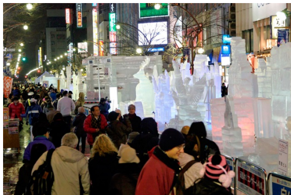
さっぽろ雪まつり すすきの会場

雪まつりでは雪像が頭に浮かびますけれども、その雪像だけではなく、さっぽろ雪まつりでは大通りの雪像と、すすきのの氷像、氷の彫刻ですね。それから札幌からちょっと離れたところに月寒ドームと言うドームがありまして、そこにいろんなアミューズメント関係の施設がある、この 3 会場で構成しております。