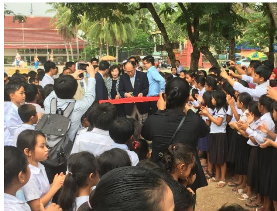
開校式テープカット